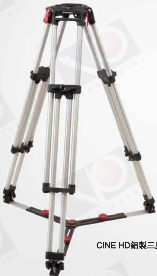
CINE HD 鋁製三腳架