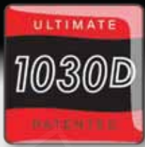
1030D極限液壓雲台 承重：13.6kg