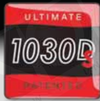
1030Ds極限液壓雲台 承重：18.6kg