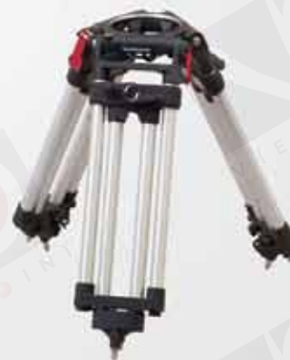
CINE HD BABY 小型三腳架